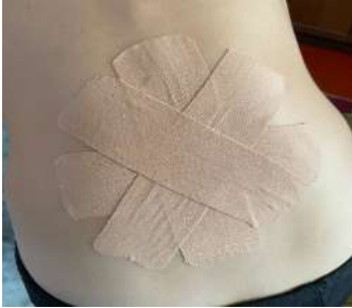
Рис. 1.2. Кінезіотейпування поперекового відділу хребта у вигляді «Хризантеми»

Методика 2 «Хризантема». Чотири І-подібні стрічки наклейте навхрест на поперековий відділ на розтягнуті м'язи (положення пацієнта: максимально нахилений вперед), натягом від 0 до 10%, а краї стрічки приклейте без натягу (рис. 1.2).