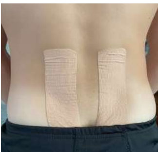
Рис. 1.1 Кінезіотейпування поперекового відділу хребта I-подібними стрічками

Методика 1. Відріжте дві I-подібні смужки тейпа. Вихідне положення хворого максимально нахилене вперед. Починайте клеїти з верхньої сідничної області. Прикріпіть тейп вгору по спині, з обох боків від хребта, щоб не натягувати, закріпіть на рівні 10-11 грудних хребців (рис. 1.1).