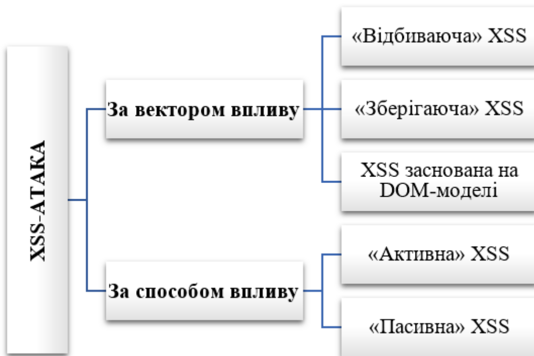
Рис. 2. Класифікація XSS [2]

Безпека мережевих технологій знаходиться на вищому рівні, на відміну від безпеки веб-додатків, тому необхідно приділити більше уваги більшій слабкій ланці, щоб уникнути ситуацій, що завдають шкоди користувачам та вжити заходів щодо скорочення втрат. Однією із небезпечних комп'ютерних атак на веб-додатки є міжсайтовий скриптинг. XSS прийнято класифікувати за двома критеріям: за вектором та способом впливу (рис. 2).