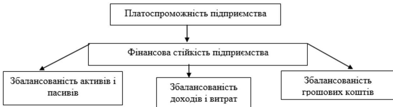
Рис. 1. Взаємозв'язок фінансової стійкості й платоспроможності підприємства

Якщо поточна платоспроможність – це зовнішній прояв фінансового стану підприємства, то фінансова стійкість – внутрішня його сторона, що забезпечує стабільну платоспроможність у тривалій перспективі, що показано на рис. 1.