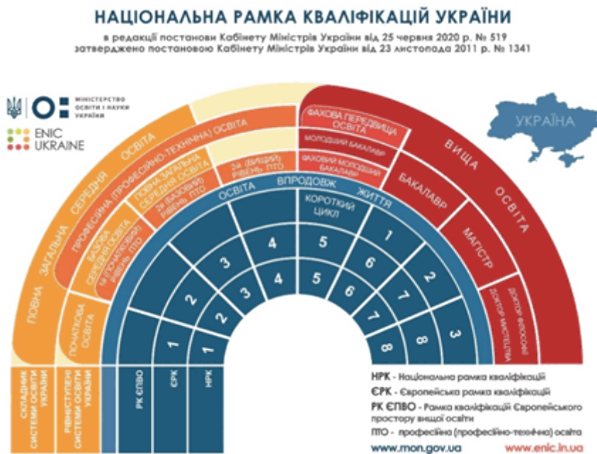
NATIONAL QUALIFICATIONS FRAMEWORK OF UKRAINE Approved by the Resolution of the Cabinet of Ministers of Ukraine № 1341, dated November 23, 2011, as amended by the Resolution of the Cabinet of Ministers of Ukraine № 519, dated June 25, 2020

Підготовка фахівців з вищою освітою Preparation in the higher education system is carried здійснюється на початковому рівні вищої освіти out at the initial level (short cycle) of higher (короткий цикл), першому (бакалаврському) education, first (bachelor's) level, second (master's) рівні, другому (магістерському) рівні та третьому level, and third (educational-scientific/educational- (освітньо-науковому/освітньо-творчому) рівні та fine arts) level leading to awarding a Junior завершується присудженням ступенів вищої Bachelor's Degree, a Bachelor's Degree, a Master's освіти: молодший бакалавр, бакалавр, магістр, Degree, and Doctor of Philosophy Degree / Doctor of доктор філософії / доктор мистецтва. Fine Arts Degree respectively.